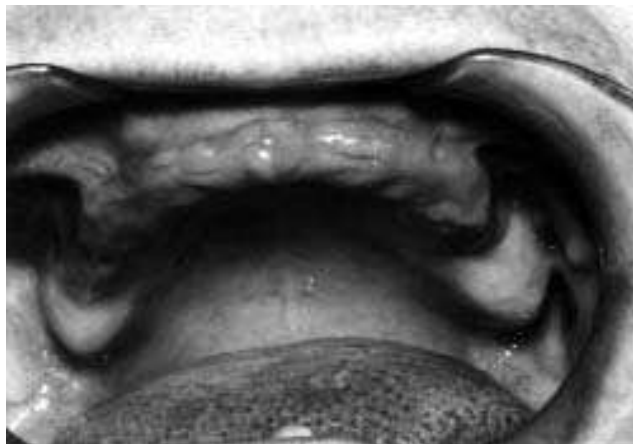
Slika 1. Bezuba gornja vilica Figure 1. Edentulousness in the upper jaw

Rentgenska snimanja su vršena svaki put kada je obavljen kontrolni pregled. Tada su vršena i merenja. To se dešavalo nakon 1, 7 i 12 godina od trenutka kada je pacijent M.J. prvi put dobila supradentalne proteze.