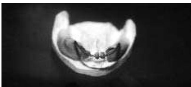
Slika 6. Figure 6.