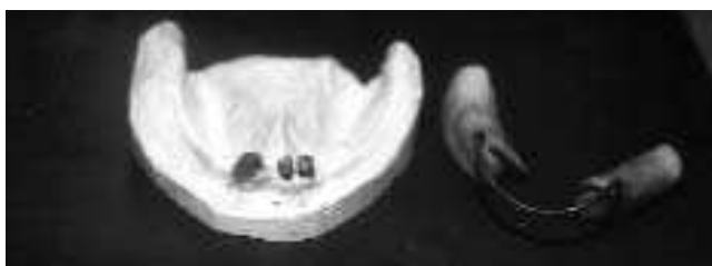
Slika 7. Figure 7

Slike 5, 6, 7. Držač filma na modelu, mrežica za merenja Figures 5,6,7. Film holder on the model, grid scale for the measurements