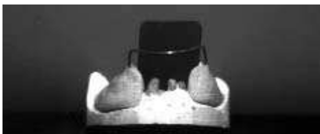
Slika 5. Figure 5.