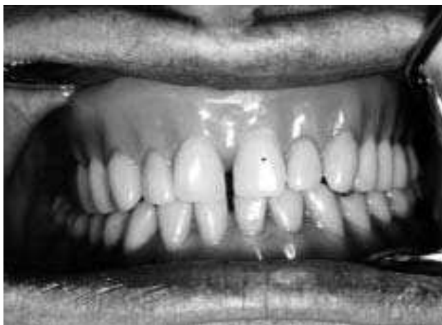
Slika 4. Totalna proteza u gornjoj a supradentalna u donjoj vilici Figure 4. Classic complete denture for the upper jaw and overdenture for the lower jaw