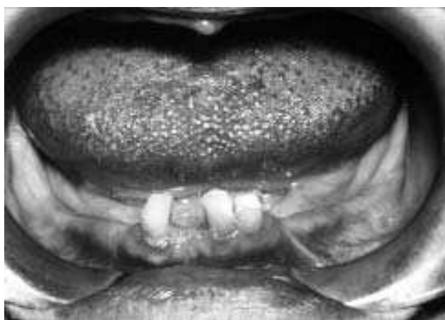
Slika 2. 3 sekutića zadržana u donjoj vilici Figure 2. 3 incisors remained in the lower jaw