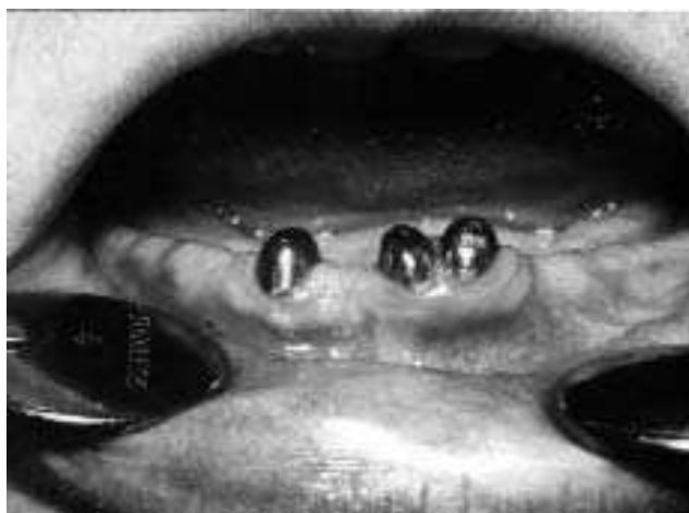
Slika 3. Posle redukcije klin.kruna ovih zuba oni su zaštićeni livenim kapicama Figure 3. After reduced clinical crowns these teeth protected by casted copings