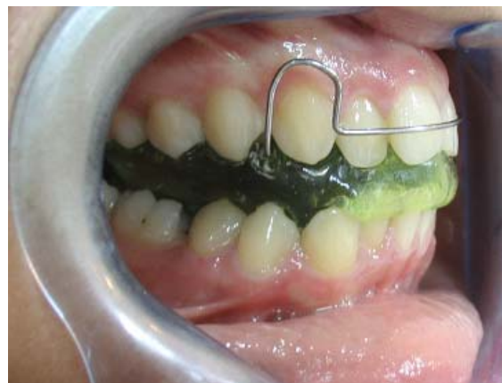
Sl. 1 – Pokretni funkcionalni aparat - aktivator prema Andresen-u

Bolesnici su bili podeljeni na dve grupe: grupa Herbst (25 bolesnika lečenih Herbst aparatom) i grupa aktivator (25 bolesnika lečenih aktivatorom). Grupu Herbst činilo je 11 muških i 14 ženskih bolesnika, starosti 14–21 godine. Grupu aktivator činilo je 13 muških i 12 ženskih bolesnika, starosti 14–17 godina. Za svakog bolesnika načinjeni su studijski modeli, ortopan i profilni telendgenski snimak glave, kao i fotografije pre i posle terapije. U grupu aktivator uvršćeni su bolesnici koji su odbili lečenje pomoću Herbst aparata, kao i alternativnu kamuflažnu terapiju ili korekciju anomalije ortognatom hirurģijom. Ovi bolesnici prihvatili su samo terapiju aktivatorom (slika 1), iako im je prethodno detaljno objašnjeno da su očekivani terapijski efekti slabi zbog njihovog uzrasta.