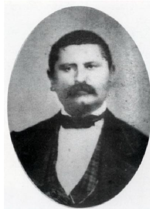
Slika 1. Đorđe Krstić (1825 – 1885) Zahvaljujemo na ljubaznosti Jasmini Trajkov, kustoscu Zavičajnog muzeja u Jagodini.

On se najpre obratio Ministarstvu unutrašnjih dela tražeći dozvolu da otvori apoteku u bilo kom mestu u Srbiji u kome bi postojali odgovarajući uslovi. Prvo je uputio molbu da otvori apoteku u Šapcu, 6. maja 1851. godine. Ne čekajući odgovor iz Šapca, Đorđe Krstić se, po nagovoru nekih prijatelja iz Beograda, počeo interesovati za otvaranje apoteke u Jagodini. Čak je i lično posetio Jagodinu. Posle pozitivnih sugestija od strane