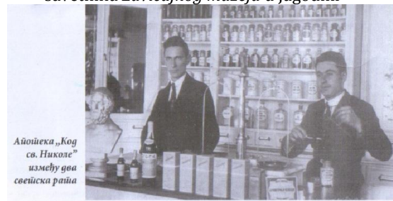
Slika 5. Apoteka Gustava Reznorovića

Kraljevina SHS je 1932. godine donela Zakon o uređenju sanitetske struke i o čuvanju narodnog zdravlja. Na spisku Apotekarskog priručnika iz