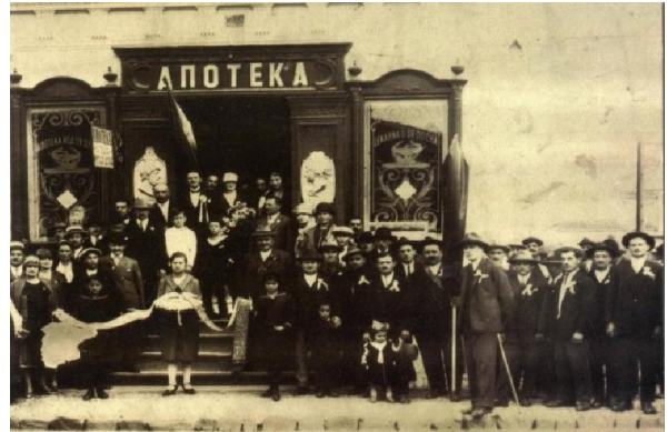
Slika 4. Apoteka Miloja Šohaja, tridesetih godina XX veka

(rođen 1887. godine) započeo je da studira farmaciju, zatim je učestvovao u Prvom svetskom ratu i diplomirao u Zagrebu 1921. godine. Radio je u nasledenoj očevoj apoteci sve do 1948, kada je ona nacionalizovana od strane tadašnje vlasti [2] (slika 4).